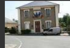
Levis Saint-Nom 78