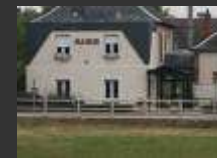
Saint-Denis les Ponts 28