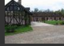
Chantier ANC 45