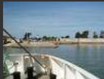
Ile d'Aix 17