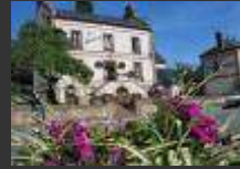
Tillières sur Avre 27