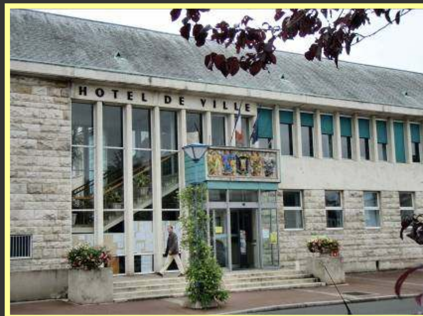
La Loupe Z.I