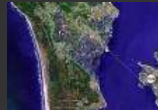
St Trojan 17