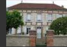
St Thibault 10